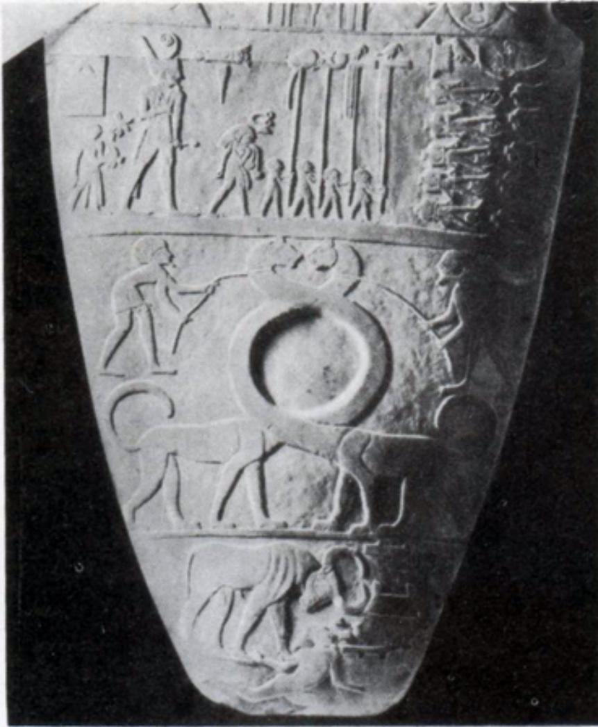
Палетта Нармера. Фрагмент. Камень. XXXI в. до н. э. Первое из известных сегодня изображений города.