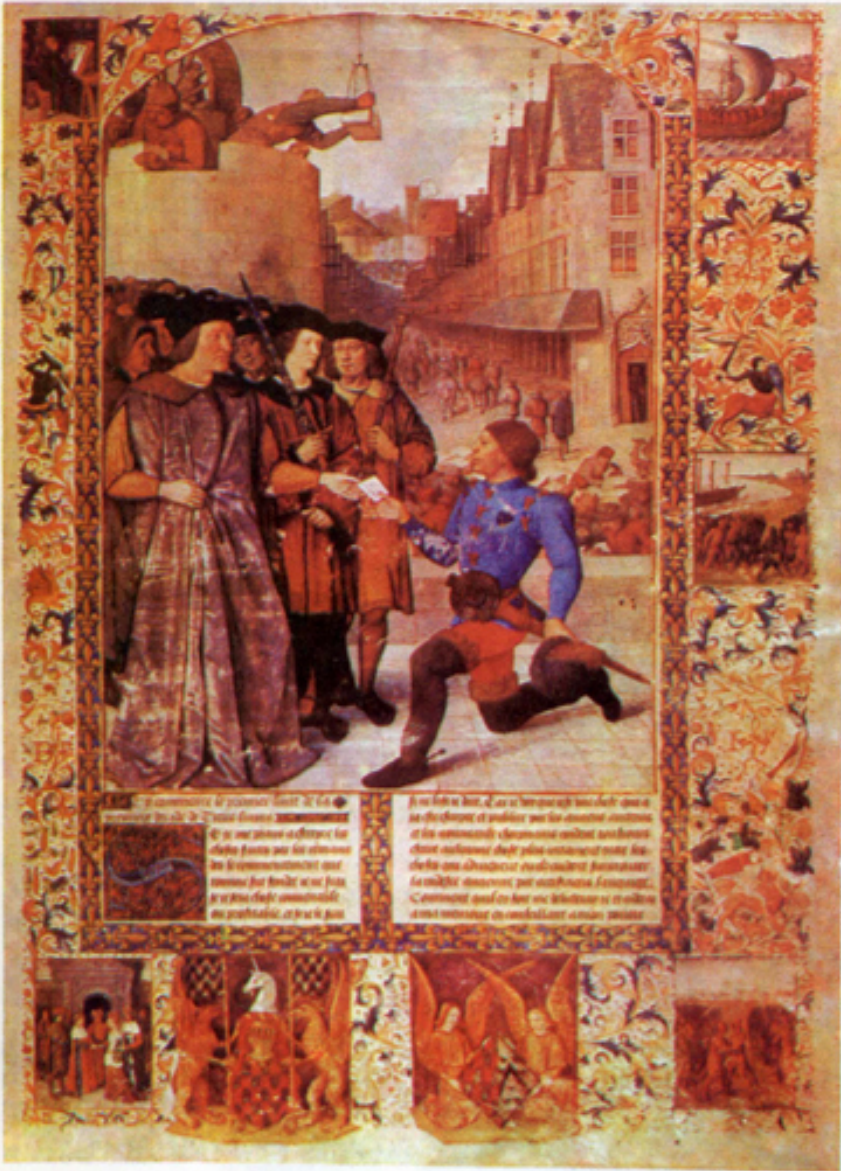
Жан Фуке (пергамент, темпера. Около 1460). «Герцог Франсуа получает письмо» — из иллюстраций к «Римской истории» Тита Ливия. «Рим» художника вполне достоверно вос-

А живопись? В эпоху классицизма она трактуется архитектура — она работает в рамках