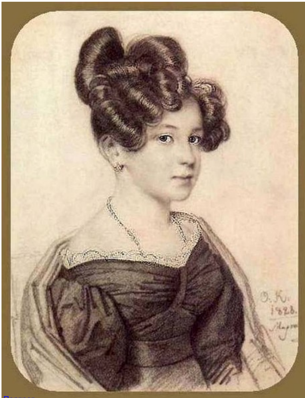
Портрет , заслуживающий особого упоминания, также связанный с Пушкиным. Анна Оленина — предмет поэтических дум Пушкина.

Он создан в нелегкое двукратное крестовое войско в 1828 году. В 1828 году он снова появился в Италии. В 1828 году он снова появился в Италии. В 1828 году он снова появился в Италии.