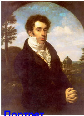
Портрет князя А. М. Голицына эпоха Возрождения