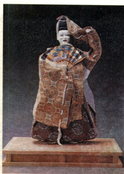
Окина — персонаж театра Но.

С историей и культурой страны связаны и другие куклы, так в городе Окина (в центре острова) есть