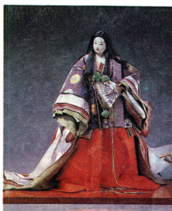
Дама в средневековом костюме.

Мы привыкли к тому, что в куклах обычно играют. В Японии существуют куклы, предназначенные только для украшения.